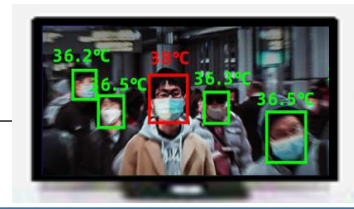
AIレコーダー（若しくはパソコン）